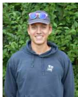
Sies Aper Leiding +20