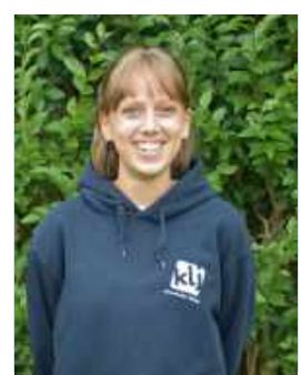
Minne Aper Leiding Jong-KLJ